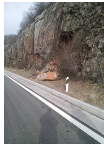
Fotografije: Odron stijene u zasjeku na trasi autoceste A6 Rijeka – Zagreb, dionice Oštrovica – Kikovica u km 69+750.